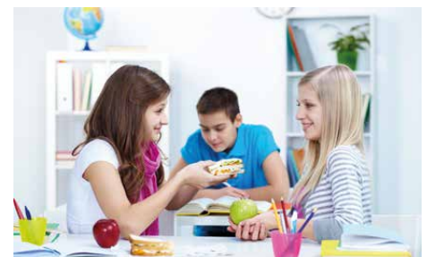
La regla de oro también es considerar los gustos de otra persona antes que los propios.

Existe también otra solución cuando alguien “apela al masoquista” y es precisamente, el entendimiento amplio de la regla dorada. Cuando uno conoce los gustos y preferencias de los otros, y uno busca complacerlos haciendo como a ellos les gusta que los traten, lo que uno está haciendo es tratándolos como le gustaría a uno que lo trataran. Es decir, cuando yo saludo al masoquista con un golpe en el hombro, lo hago porque se que eso a él le produce placer, mientras que él me puede saludar de vuelta con un apretón de manos (medurado); yo tengo la consideración de preguntarme cómo le gustaría a él ser tratado y él tiene la consideración conmigo de preguntarse cómo me gustaría a mí ser tratado. En última instancia ambos estamos tratando al otro como nos gustaría que nos trataran: con consideración a nuestras preferencias. ( Perdón por la caricatura de ejemplo, pero lo hago buscando economía con claridad, espero haberlo logrado ).