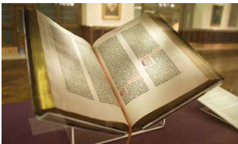
La Biblia. Conjunto de libros canónicos del judaísmo y el cristianismo.

Pero como ya hemos visto, la regla dorada precede las religiones modernas, Jesús y los demás líderes religiosos relevantes hoy –Buda, Zoroastro y, el seglar, Confucio antes que él, así como Mahoma después, entre otros- han proclamado todos alguna variante de este principio, ninguno ( hasta donde alcanza mi entender ) otorgándole crédito a algún antecesor –vergüenza debería haberles dado a quienes plagiaron la idea, que si no son todos, fueron la mayoría. El caso particular de Jesús es relevante, porque él era judío, por lo que Levítico 19:34 era parte de su cultura ( la cita se encuentra al inicio de este escrito ).