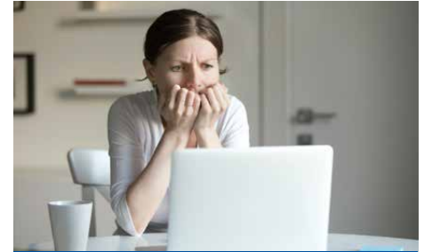
Masoquista. Se aplica a la persona que disfruta con un pensamiento, situación o hecho desagradable y doloroso.

sas, no son bien recibidas. Existe, por tanto, una calibración social.